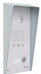
Wetterschutzdach Toit de protection