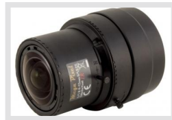
H04203NFDC-MP | Artikelnummer: 213619