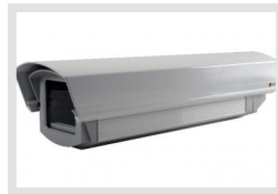
VHM/ECLKB-W | Artikelnummer: 79676