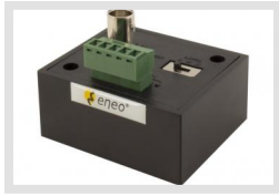
TVA-1201TRA | Artikelnummer: 212984