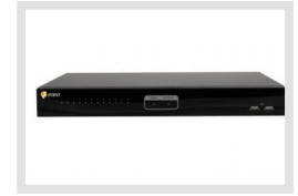
MAM-6ME1012MTA | Artikelnummer: 219643