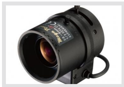
F0222.8DC-NFSDH | Artikelnummer: 43277