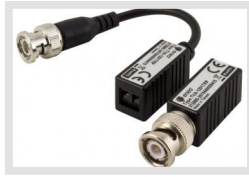
TVA-1201TRP | Artikelnummer: 212985