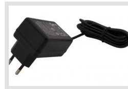
PS12DC-11 | Artikelnummer: 218653