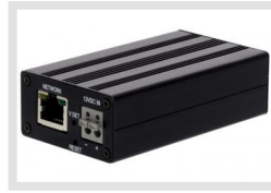
MAM-5ME1001MTA | Artikelnummer: 217344