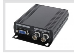
MAM-5MM1001MOA | Artikelnummer: 220299