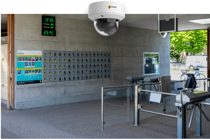
Neuralgische Bereiche: Eingänge und Schliessfächer