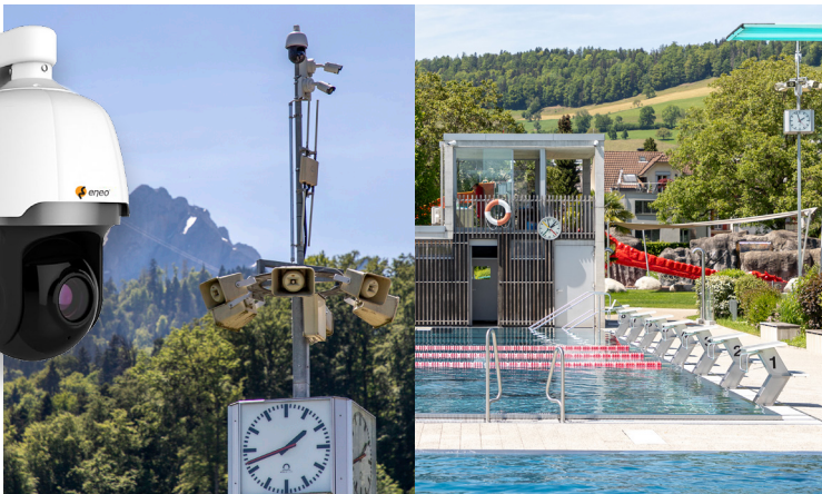
Schnellschwimmer, Turmspringer und den Pilatus immer im Auge

KOCH ist vor allem für sein über Jahrzehnte bewährtes TC:Bus-Türsprechsystem bekannt. Auch in den Krienser Bädern ist dieses im Einsatz. Darüber hinaus ist KOCH für Zutrittskontrollsysteme, Intercom-Anlagen oder gleich die kombinierte Nutzung all dieser Systeme der ideale Partner. Wir beraten Sie gerne.