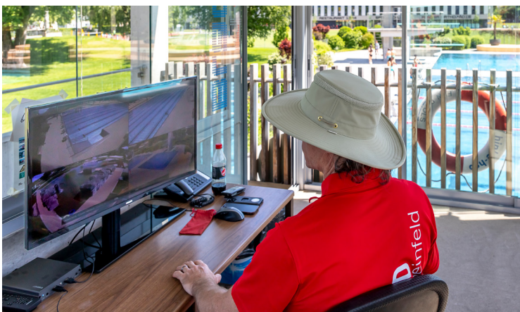
Mehrere Becken gleichzeitig im Blick des Bademeisters

René Koch AG Seestrasse 241 8804 Au/Wädenswil 044 782 6000