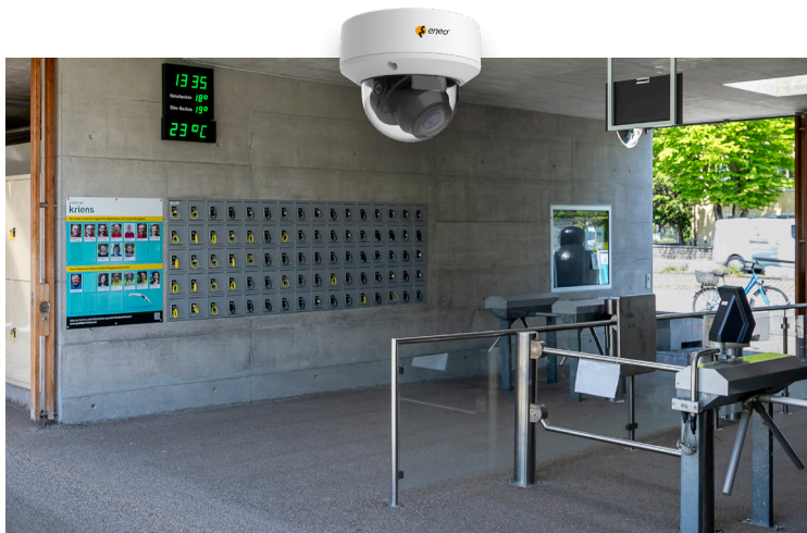
Les entrées et les casiers, des espaces clés.