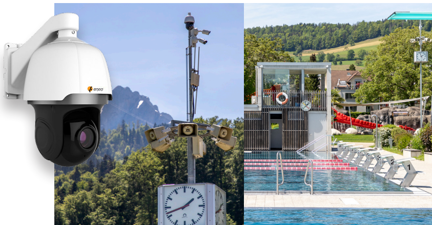
Les nageurs rapides, les plongeurs et le Pilate toujours en vue.